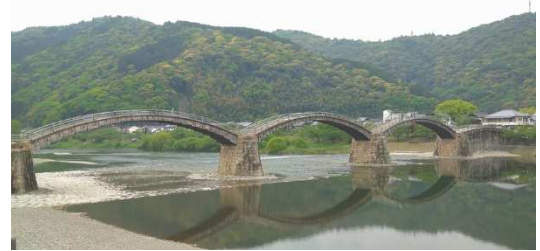
山口県岩国 錦帯橋

※2 平均的な収入(平均標準報酬(賞与含む月額換算)43.9万円)で40年間就業した場合に受け取り始める年金(老齢厚生年金と2人分の老齢基礎年金(満額))の給付水準。厚生省が出しているサンプル金額ですが、夫婦2人分の老齢基礎年金の満額入れて、 はて 一般的な数字としてとらえることができる?