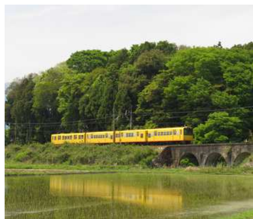
ナローゲージの三岐鉄道北勢線 明智川拱橋にて2014.5

④ 武見敬三厚生労働大臣は、マイナ保険証の利用を増やした医療機関に最大20万円支給する方針を明らかにした。5～7月を集中取組月間とし、この間に利用者数を増やした診療所には最大10万円、病院には同20万円を支給する。マイナ保険証の利用率は3月時点で3.47%と低迷している。（4/9）