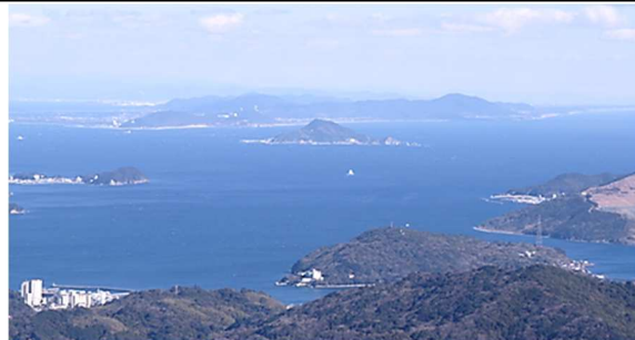
伊勢志摩スカイラインから神島、渥美半島を臨む

① 障害者雇用促進法において、事業主には、障害者雇用率以上の割合で対象障害者を雇用する義務が課されています。この法定の障害者雇用率が、令和3年3月1日から0.1%引き上げられて「2.3%」になります。障害者雇用率の引上げに伴い、対象障害者を1人以上雇用する義務のある一般事業主（一定の特殊法人を除く）は、常時雇用する労働者の数が43.5人以上の事業主となります（1人÷100分の2.3）。