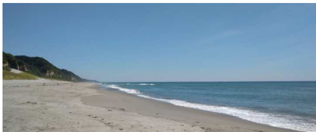
青森県「伊古部海岸」.....NHK TV朝ドラ「エール」にも登場.....

⑤ 雇用調整助成金の支給申請について、令和2年1月24日(※)から6月30日までに判定基礎期間の初日がある休業等についてのまとめた申請が令和2年9月30日まで可能に。また、1日当たりの上限額を1万5000円に引き上げるなど、 特例措置は来月末を12月末まで延長 することに。(8月28日)