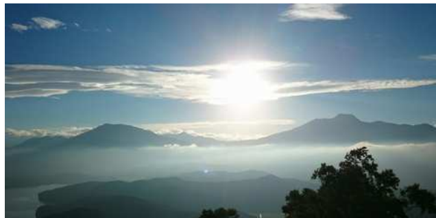
北信州 斑尾高原 野尻湖テラスから

④ 厚生労働省は8/9、平成28年度中に実施した監督指導による賃金不払残業の是正結果を公表しました。今回の取りまとめは、賃金不払い残業に関する労働者の申告や各種情報に基づいて労基署が監督指導を行った結果、遡及支払いされた割増賃金額が1企業当たり100万円以上となった件数等を集計したものです。その結果によると、平成28年度中の是正企業数は1349企業となり、27年度に比べて1企業の増加。遡及支払いの対象となった労働者数は9万7978人（前年度比5266人増）で、支払われた割増賃金の合計額は127億2327万円（同27億2904円増）となっている。このうち、遡及支払い額が 1000万円以上に上った企業数は184企業 で、遡及支払い額は91億3706万円と全体の約72%を占めています。