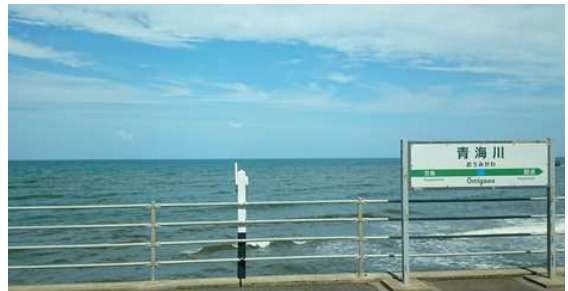
JR 信越線 海に一番近いホームの駅「青海川駅」

厚生年金保険料〔一般〕の料率は 18.3% ( 91.5/1000 労使各負担分 ) です。ついに 厚生年金保険料を毎年上げてゆくルールの料率上限に達しました 。給与に対する保険料率(健康保険+介護保険+厚生年金保険+雇用保険)は、15.235% ※健保組合は組合毎に料率が異なります。雇用保険では建設業は異なります。「社会保険の月額変更届」で「 7月変更・8月変更 」となった場合、その変更後の等級が来年8月まで続きます⇒定時決定通知書で再度変更しないようご注意ください。9月変更も定時決定より優先されます。