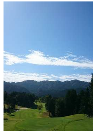
秋空と「みずなみカントリーの18番ホール」